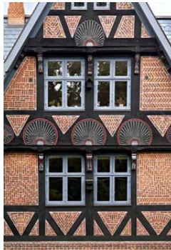
STEN. Ikke to felter er ens.