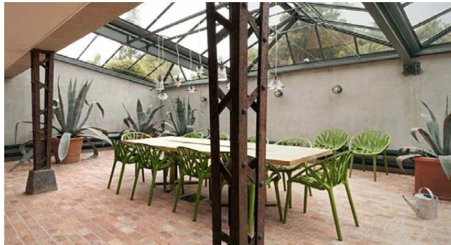
MØDELOKALE. Et par gamle nittede københavnske lystpæle er stillet på hovedet og brugt som søjler i vinterstuen.