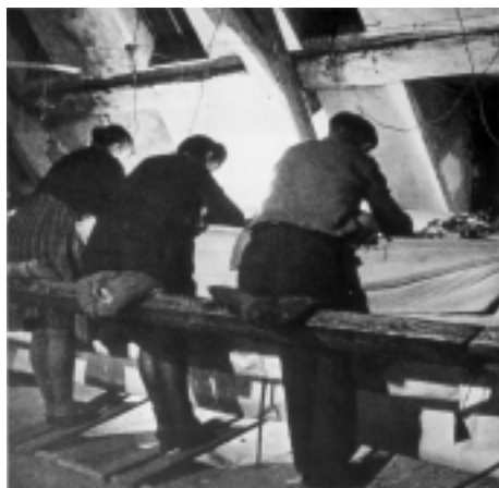
Basse lisse-vævere i et værksted i Aubusson, 1946. Væverne sidder bøjet over den vandretstående væv og har vrangen af motivet ud mod sig. I et lille spejl, der skubbes ind under kædestrådene, kan væveren kontrollere forsiden af motivet. Skellet skiftes ved at trampe i pedalerne med fødderne.

En modsætning til basse lisse-vævning er den lidt senere haute lisse, hvor væveren står ved en lodret vævestol. Begge teknikker anvendtes i 1700-tallet, men hvor en dygtig væver gennemsnitlig kunne væve 1\frac{1}{4} m 2 om året på opretstående væv, var gennemsnittet på den vandrette væv på 2,65 m 2 årligt. Dette kan studeres nærmere på den film, som vises om gobelinvævningsteknik i udstillingen.